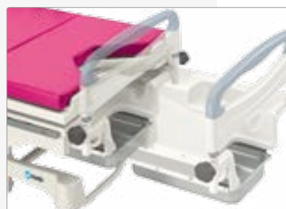
Ножную секцию ложа с регулировкой продольного положения можно полностью задвинуть под сиденье