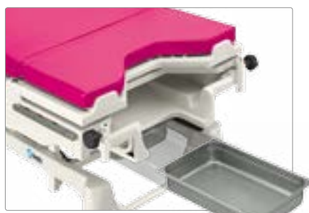
Выдвигающийся съемный лоток для физиологических жидкостей