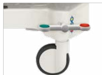
Центральная блокировка колес. Три положения: блокировка направления, блокировка снята, все колеса заблокированы