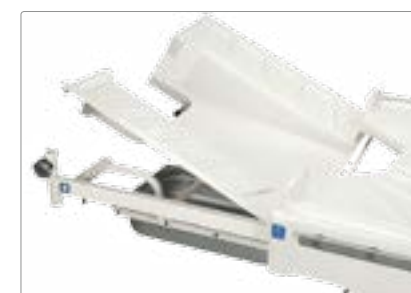
Съемные покрытия из ABS-пластика ножной секции и секции сиденья упрощают поддержание кровати в чистоте