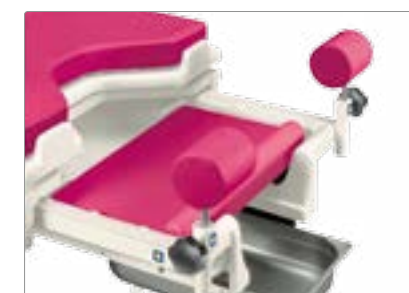
Матрац для новорожденного может быть использован, в частности, при перерезании пуповины и очищении дыхательных путей новорожденного