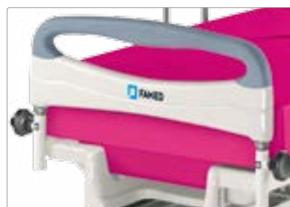
Съемный низкий ножной торец кроватей LM-01.4, LM-01.3, LM-01.5